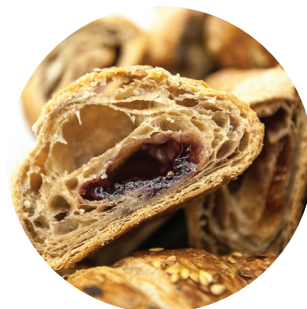
PRODOTTI DA FORNO PRONTO USO